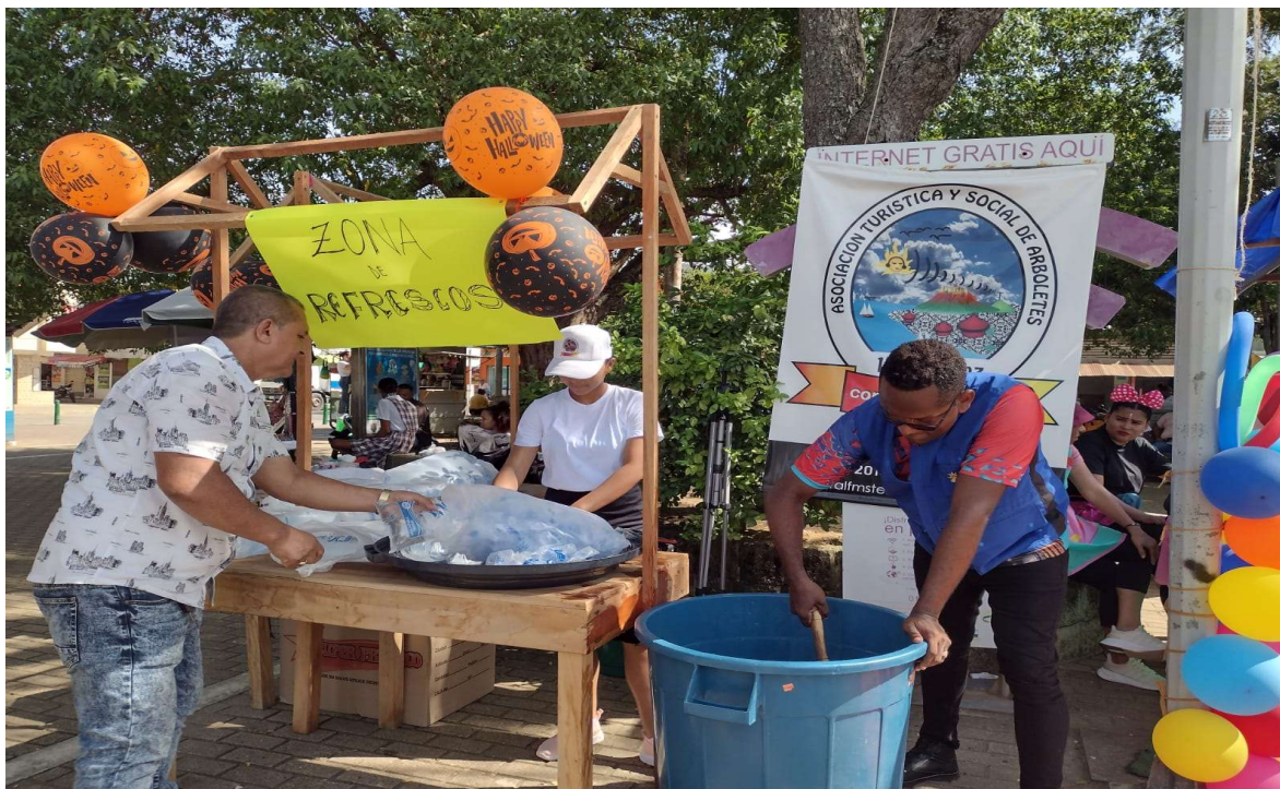
PRESENTES EN EL DIA DE LOS SUEÑOS DE LOS NIÑOS

ASOCIACIÓN TURÍSTICA Y SOCIAL DE ARBOLETES NIT.811.009.673-1