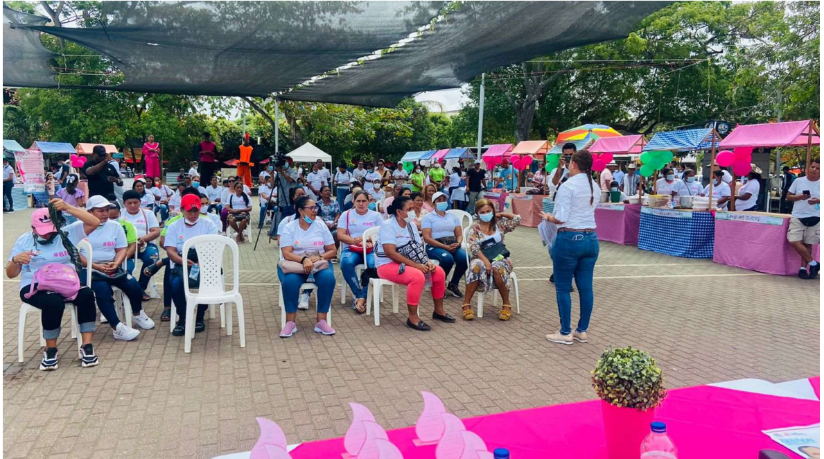
ACOMPañAMIENTO MERCADO CAMPESINO

ASOCIACIÓN TURÍSTICA Y SOCIAL DE ARBOLETES NIT.811.009.673-1