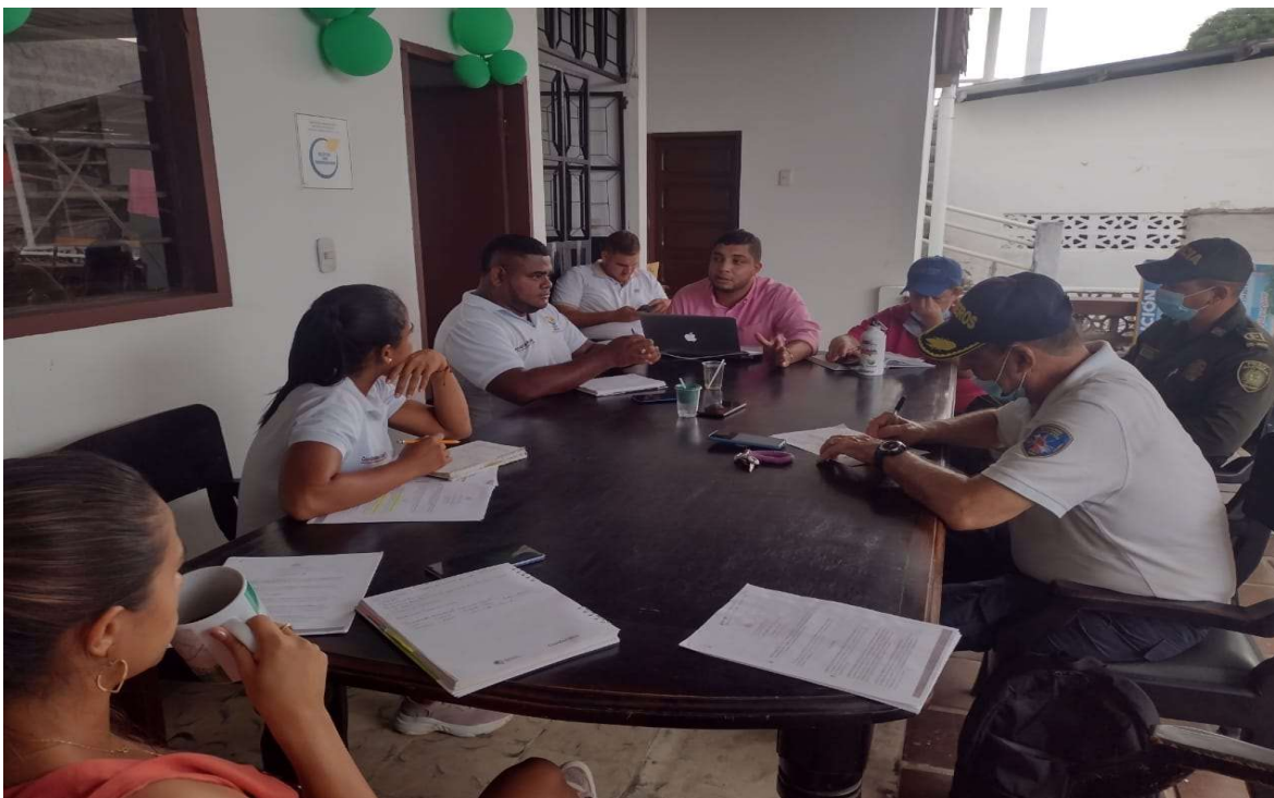
PRESENTES EN LA SOCIALIZACION DE LA APLICABILIDAD DEL COMPARENDO AMBIENTAL

ASOCIACIÓN TURÍSTICA Y SOCIAL DE ARBOLETES NIT.811.009.673-1