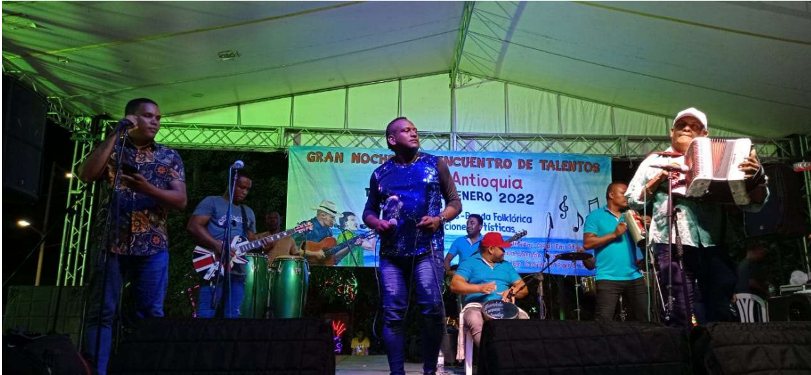
ORGANIZACIÓN EVENTO DE REENCUENTRO 2022.

ASOCIACIÓN TURÍSTICA Y SOCIAL DE ARBOLETES NIT.811.009.673-1