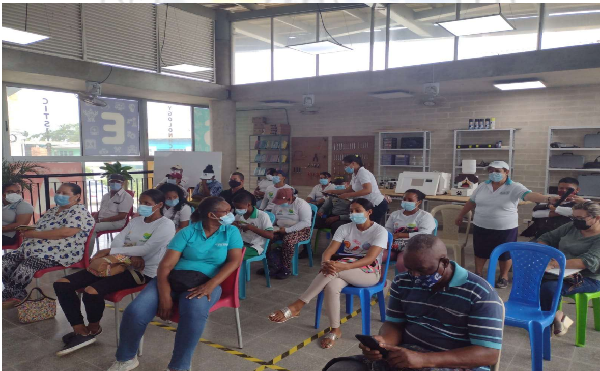
PRESENTES EN LA CONMEMORACION DEL DIA MUNDIAL DEL MEDIO AMBIENTE.