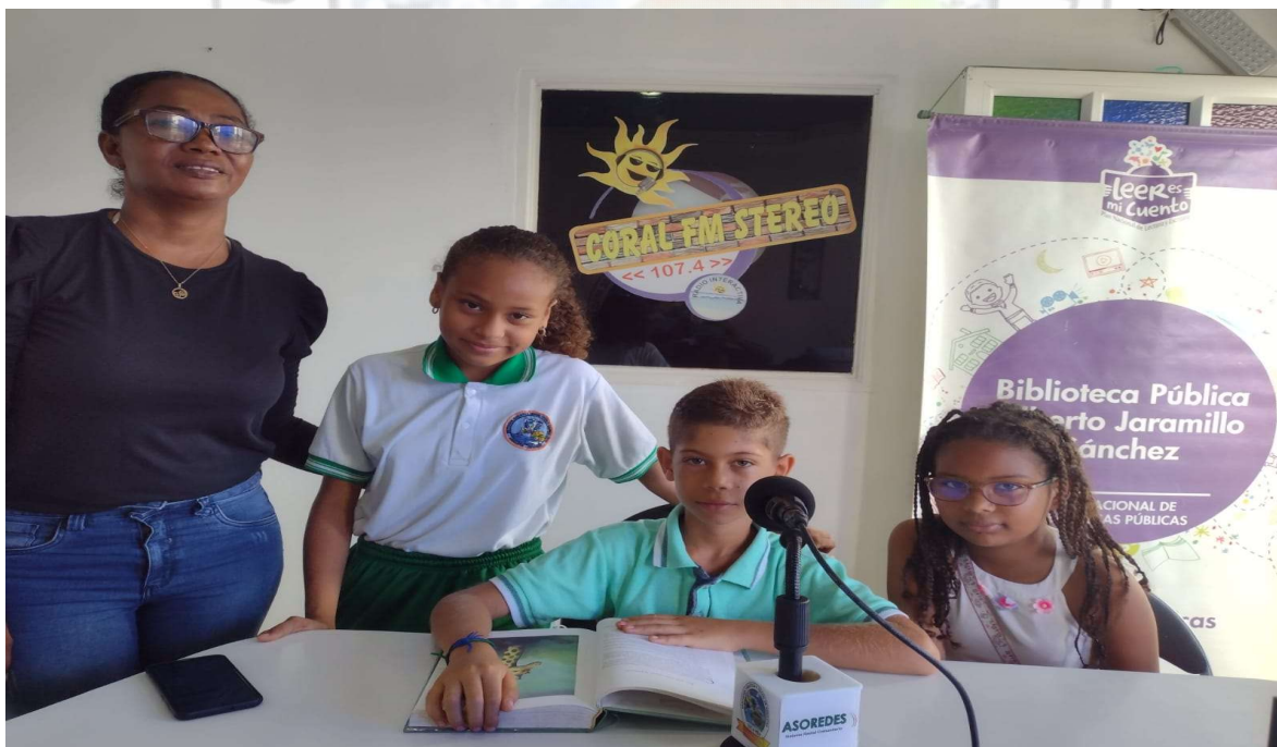
PROGRAMA LEER ES MI CUENTO