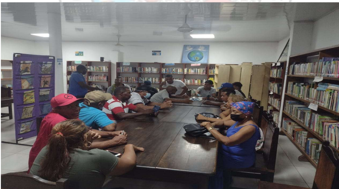
ACOMPañAMIENTO REUNION DE CULTURES DEL MUNICIPIO