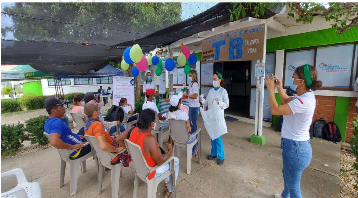
ACOMPAÑAMIENTO CONMEMORACION DIA CONTRA LA TUBERCULOSIS