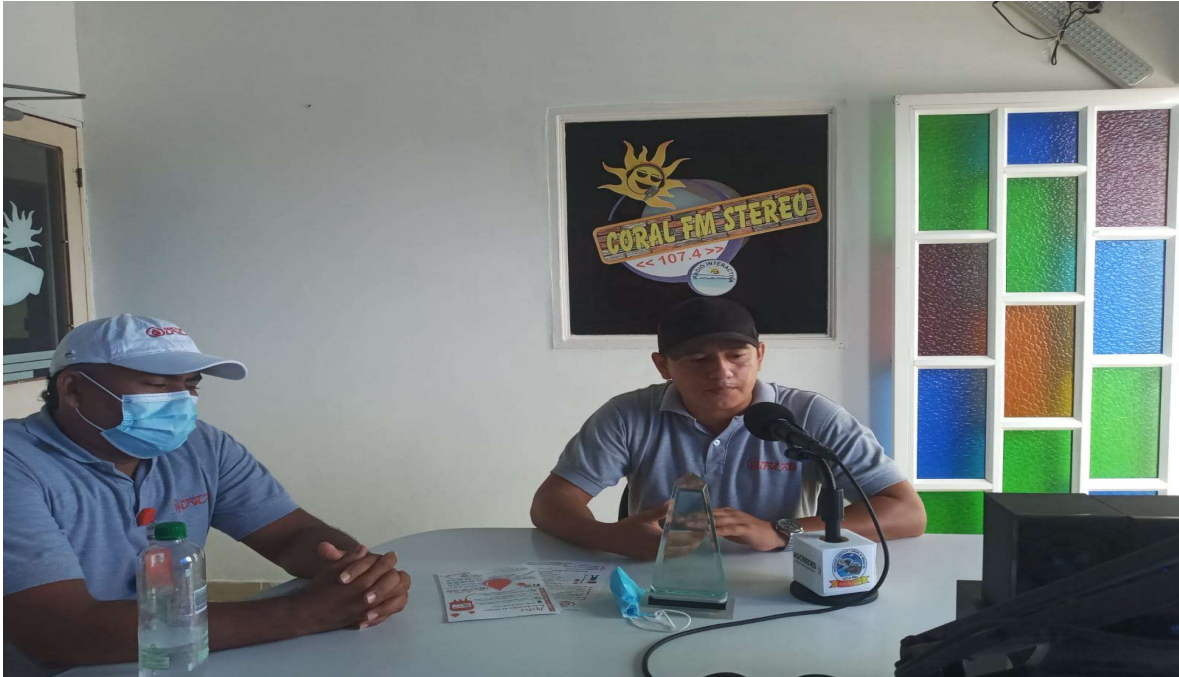
BANCO DE SANGRE INVITANDO A DONAR SANGRE

ASOCIACIÓN TURÍSTICA Y SOCIAL DE ARBOLETES NIT.811.009.673-1