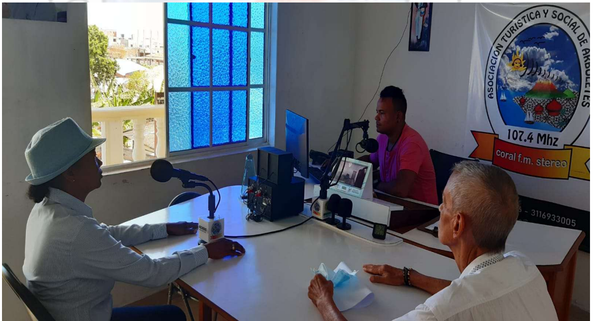
SE REALIZO DIFUSION DE LAS ACTIVIDADES DE RECICLAJE REALIZADAS POR UN GRUPO DE RECICLADORES A NIVEL MUNICIPAL.