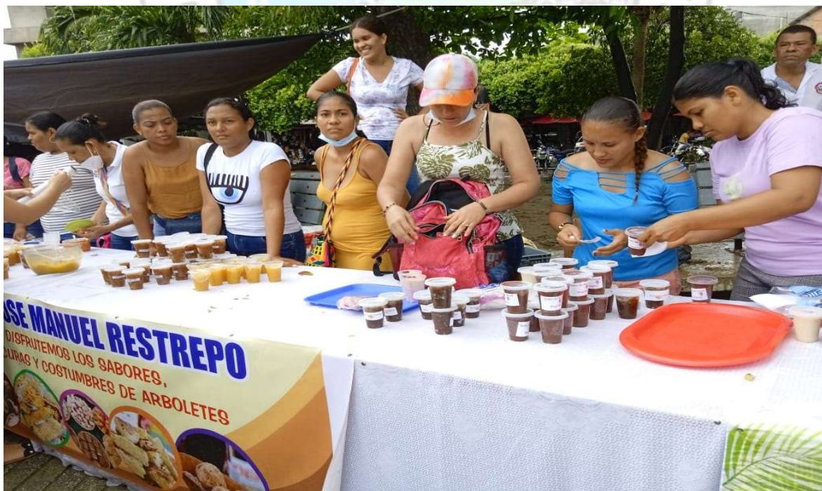
ACOMPañAMIENTO A LA I. E JOSE MANUEL RESTREPO EN EL FESTIVAL DEL DULCE