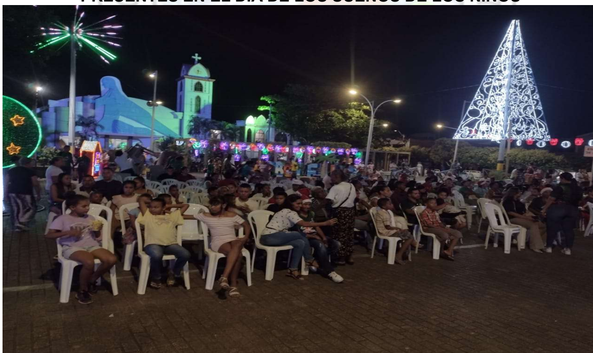
PRESENTES EN EL CONCIERTO NAVIDEÑO PARQUE PRINCIPAL