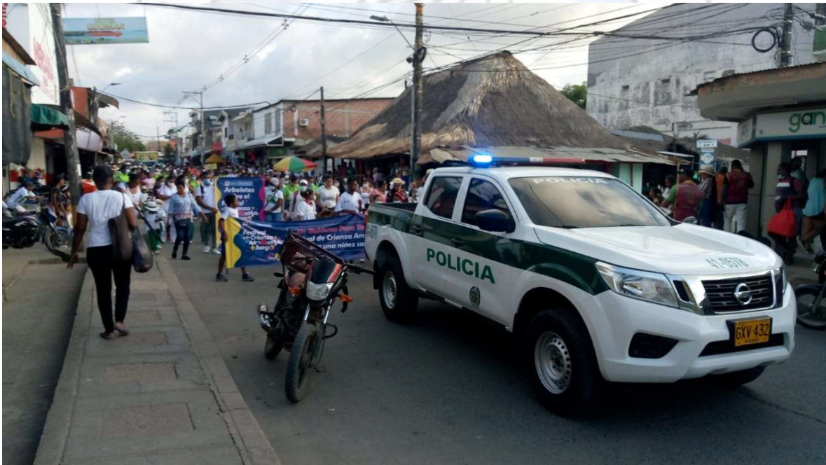
DESFILE FESTIVAL DE LA CRIANZA AMOROSA