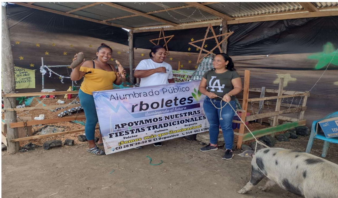
ACOMPañAMIENTO ENTREGA DE REGALOS Y PREMIACION MEJOR PESEBRE

ASOCIACIÓN TURÍSTICA Y SOCIAL DE ARBOLETES NIT.811.009.673-1