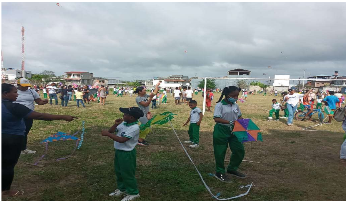
ACOMPANAMIENTO DIA DE LA COMETA

ASOCIACIÓN TURÍSTICA Y SOCIAL DE ARBOLETES NIT.811.009.673-1