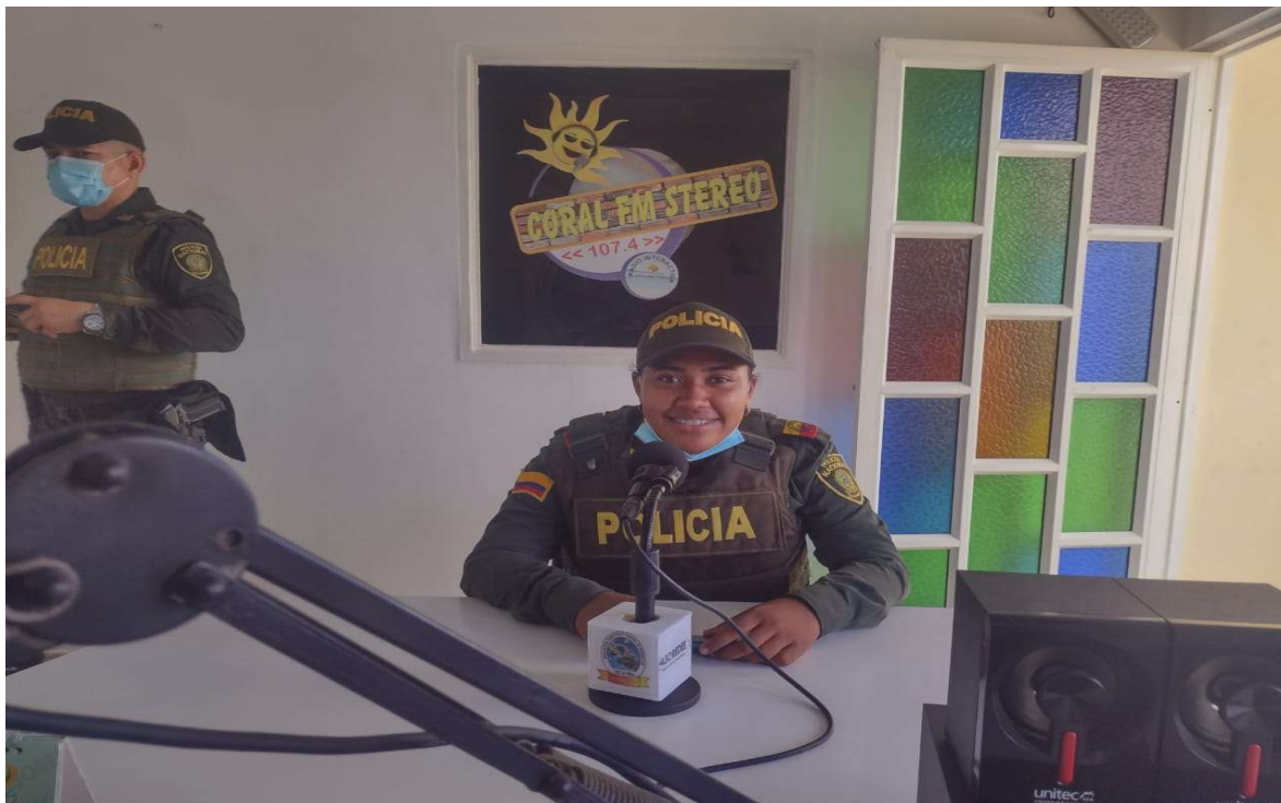
INFORMACION POR PARTE DE LA POLICIA NACIONAL

ASOCIACIÓN TURÍSTICA Y SOCIAL DE ARBOLETES NIT.811.009.673-1