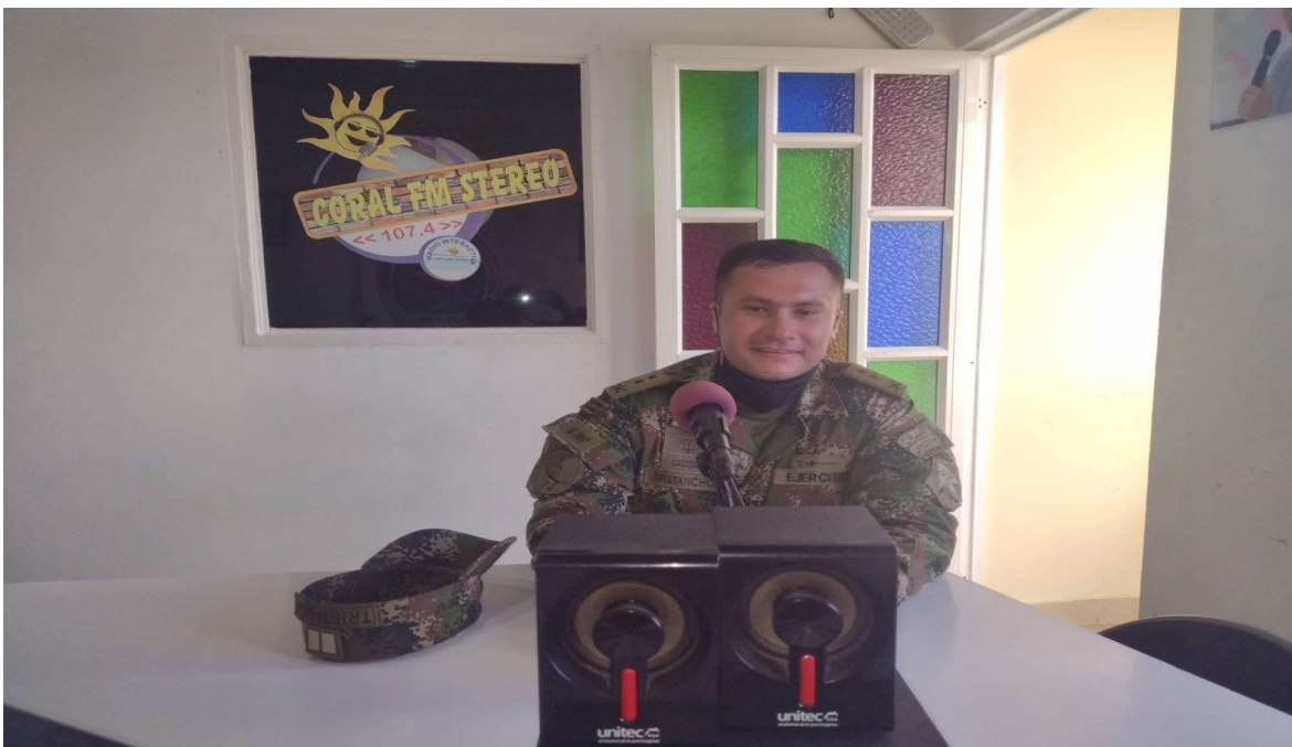
APOYO AL EJERCITO NACIONAL JORNADA DE RECLUTAMIENTO

ASOCIACIÓN TURÍSTICA Y SOCIAL DE ARBOLETES NIT.811.009.673-1