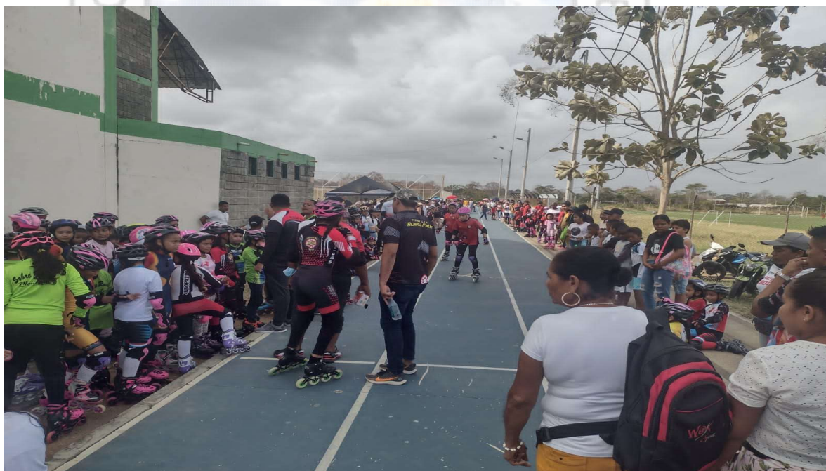
ACOMPANAMIENTO INTERCAMBIO DE PATINAJE MONTERIA ARBOLETES.