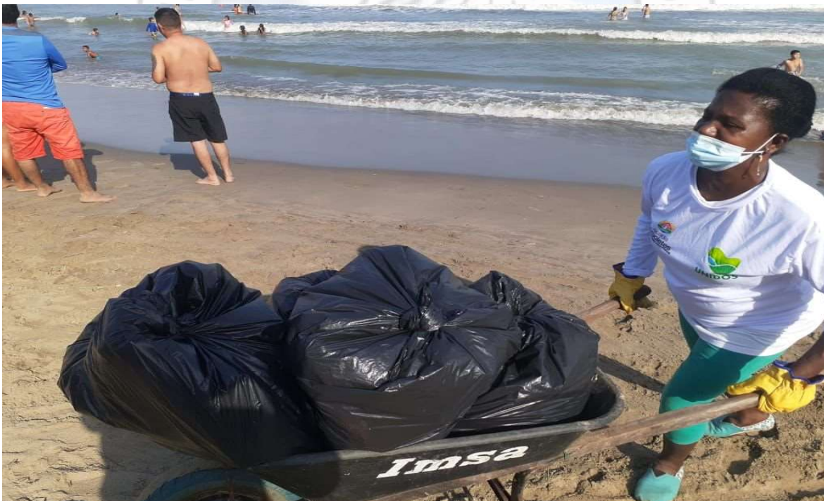
ACOMPANAMIENTO JORNADA DE LIMPIEZA DE LAS PLAYAS.