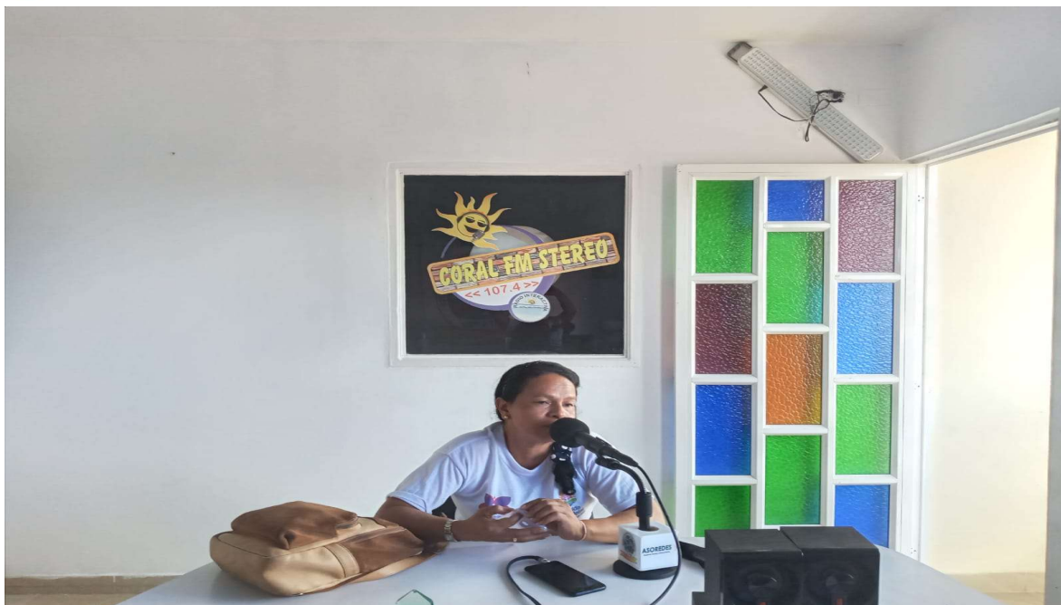
INFORMACION RELACIONADA A PAGOS DE FAMILIAS EN ACCION

ASOCIACIÓN TURÍSTICA Y SOCIAL DE ARBOLETES NIT.811.009.673-1