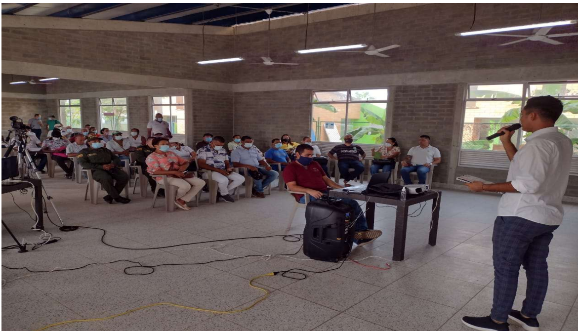
PRESENTES EN LA SOCIALIZACION DE LA PLAZA DE MERCADO

ASOCIACIÓN TURÍSTICA Y SOCIAL DE ARBOLETES NIT.811.009.673-1